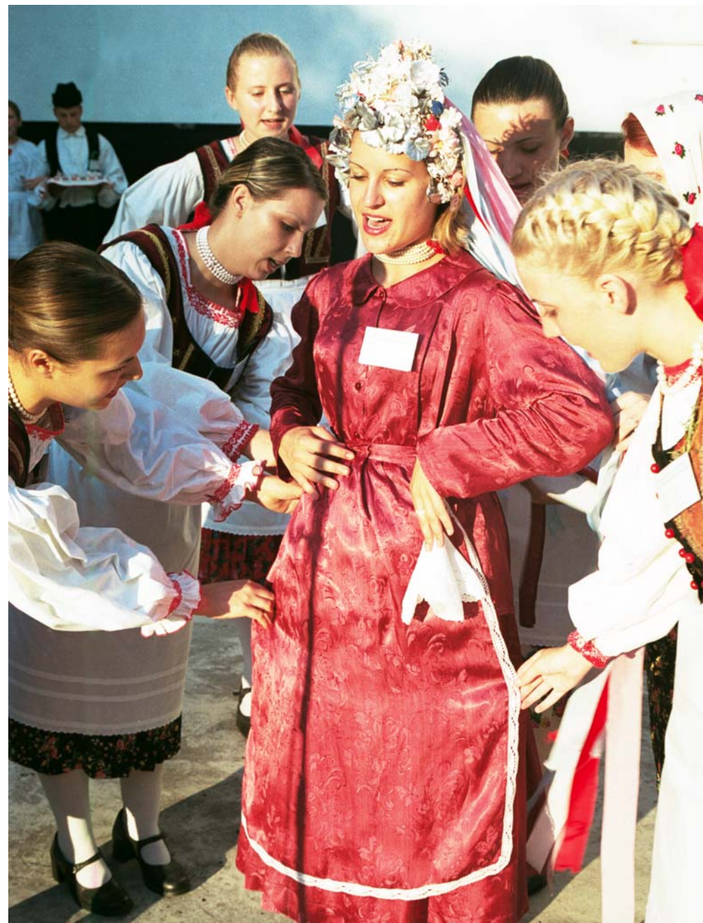
13. Bukovinai Találkozások • Magyarország • Bonyhád • 2-4.08.2002