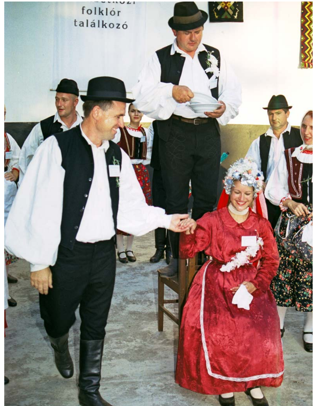
13. Bukovinai Találkozások • Magyarország • Bonyhád • 2-4.08.2002