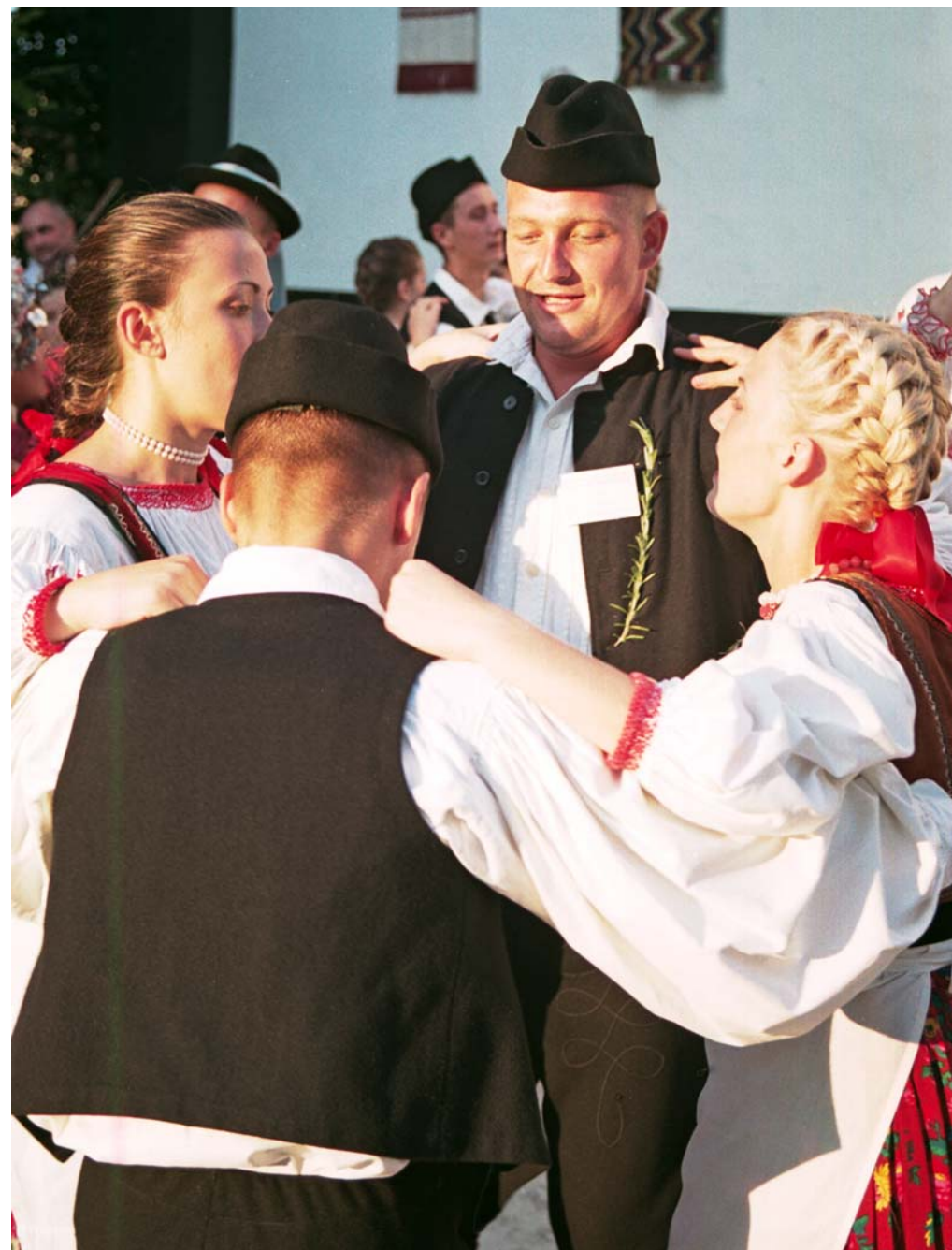
13. Bukovinai Találkozások • Magyarország • Bonyhád • 2-4.08.2002