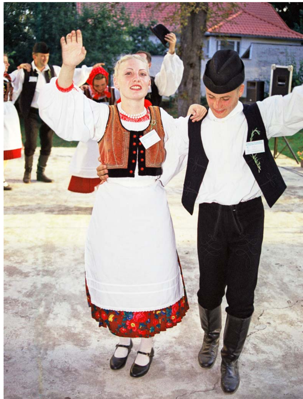
13. Bukovinai Találkozások • Magyarország • Bonyhád • 2-4.08.2002